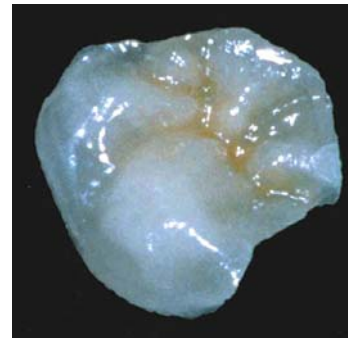
Mit unserer e.max-Vollkeramik fertigen wir vielseitige, stabile und sehr ästhetische Teilkronen und Inlays.

■ Ausführliche Informationen zur Präparation und Befestigung stellen wir Ihnen gerne zur Verfügung.